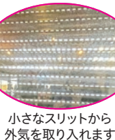
小さなスリットから外気を取り入れます