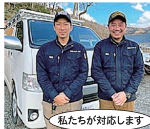
私たちが対応します