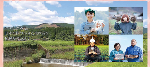
ツマミクルは、日本全国の小さな生産者を応援しています。