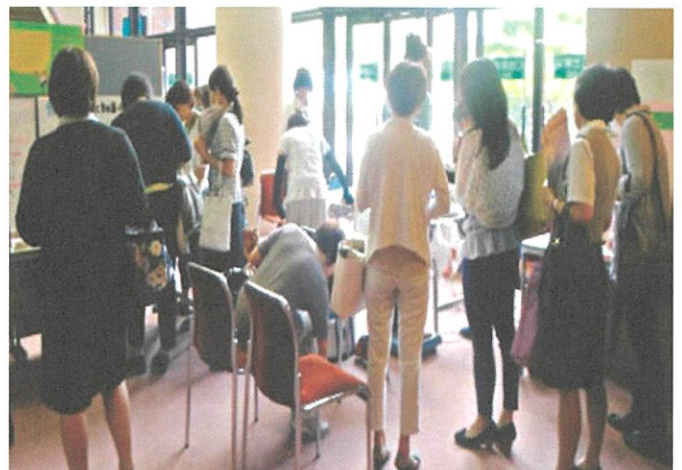
昨年の健康経営セミナーの様子

平成31年2月8日(金) ホクト文化ホール (長野市) 14日(木) キッセイ文化ホール (松本市) 20日(水) 上田市丸子文化会館 (上田市) 27日(水) 駒ヶ根市文化会館 (駒ヶ根市)