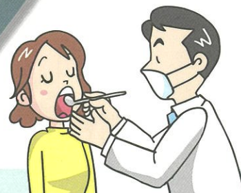
% 定期的に歯科健診(検診)を受ける人の割合 (平成28年度)

全国:厚生労働省「平成28年国民健康・栄養調査」 長野県:「平成28年度長野県歯科保健実態調査」